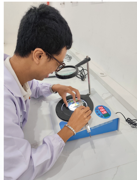
Mahasiswa Kedokteran Gigi Unesa sedang mengikuti perkuliahan dan praktik di laboratorium.