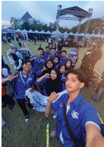
AKTIVITAS mahasiswa anggota UKM Riset dan Demokrasi Unesa dalam berbagai kegiatan untuk menunjukkan eksistensinya.

Meski begitu, pengalaman-pengalaman awal justru menjadi cerita yang tak terlupakan bagi mereka. Salah satunya saat Risdem pertama kali mengikuti kegiatan Ramadhan di kampus yang mewajibkan setiap UKM membuka stan kegiatan. Mereka sempat kebingungan mengurus